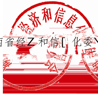
湖南省经济和信息化委员会