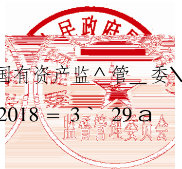
湖南省国有资产监督管理委员会